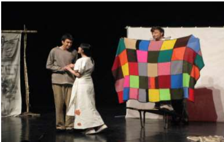
Satiričko kazalište mladih, Slavonski Brod: „DEKAMERON“

Predstava „Dekameron“ bila je uvrštena u program Festivala posljednjeg dana, 29. rujna 2012., izvedena je u Kulturnom domu u Postojni pred punim gledalištem, a publika ju je izuzetno dobro primila, glumci su zbog gromoglasnog pljeska tri puta izlazili na poklon.